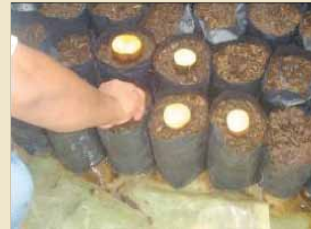
Semillas de palta en bolsas de sustrato

Para sembrar las semillas tenemos que colocar una en cada bolsa de sustrato, la parte de la punta debe estar hacia abajo y la parte de la base hacia arriba.