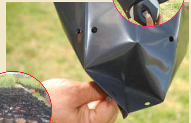
Sustrato embolsado y regado.

Antes de colocar el sustrato debemos perforar las bolsas en cada uno de sus laterales y en su base (abajo). Luego, ponemos el sustrato en las bolsas y regamos.