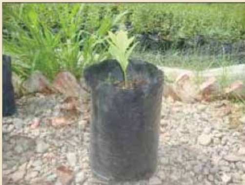
Un plantín en sus primeros meses de vida