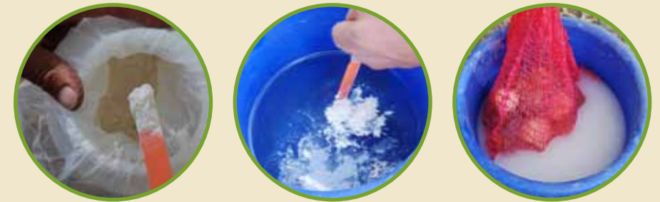
Fungicida a base de cobre.

Después de hacer los cortes, debemos desinfectar la semilla con fungicida para que no le entren enfermedades.