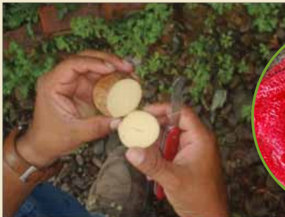
Corte de la semilla en la parte de la base

Cortar medio centímetro de la base de la semilla y un centímetro y medio en la punta.