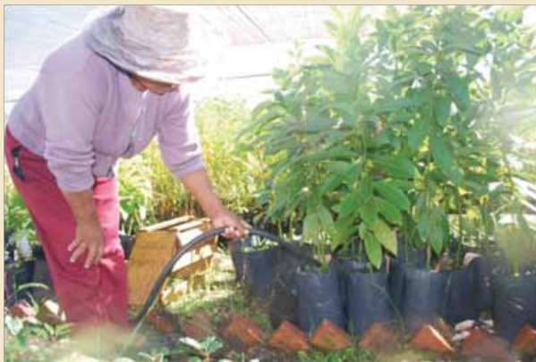
Riego con manguera