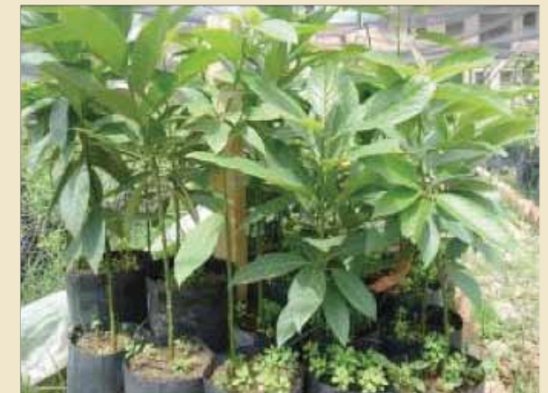
Plantines listos para ser injertados