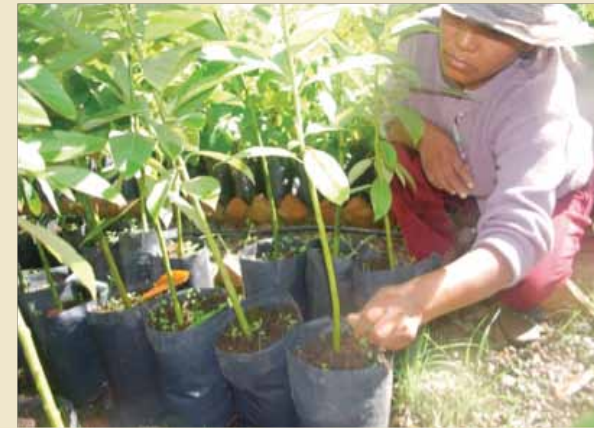
Etapa de deshierbe en un vivero