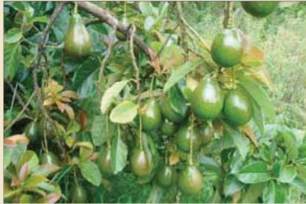
Árbol sano y con frutos de buena calidad

Debemos cortar alrededor del fruto para sacar la semilla sin dañarla y luego ponerlas en baldes o bañadores limpios.