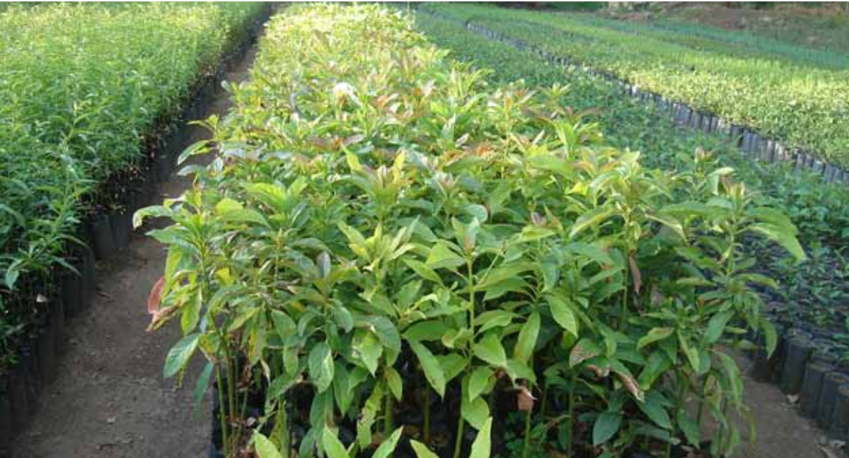
Plantines de palta en vivero

Es importante hacer una buena multiplicación de nuestros plantines de palta para luego usarlos como portainjertos, porque realizando el injertado tendremos un mejor rendimiento en nuestros cultivos, una producción más rápida y de mejor calidad.