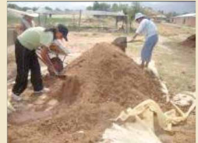
Mezcla del sustrato.